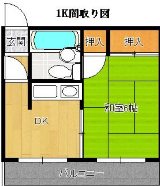
間取り図は現況を優先します。