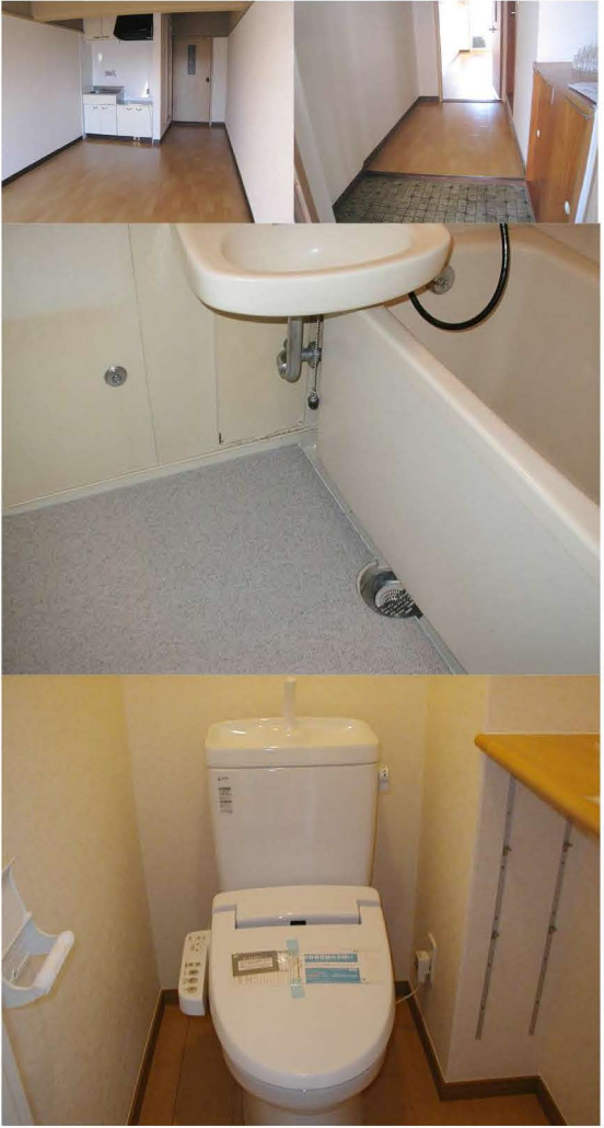
※図面は現況を優先とします。