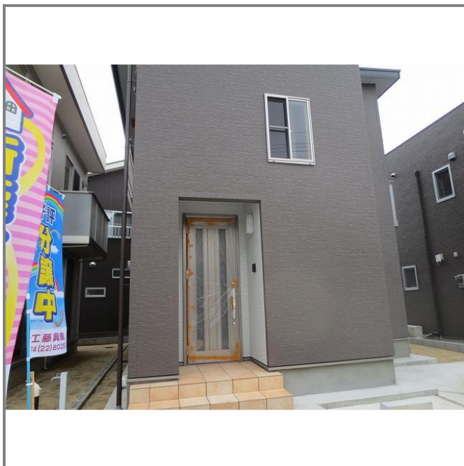
ウォークインクローゼット付き