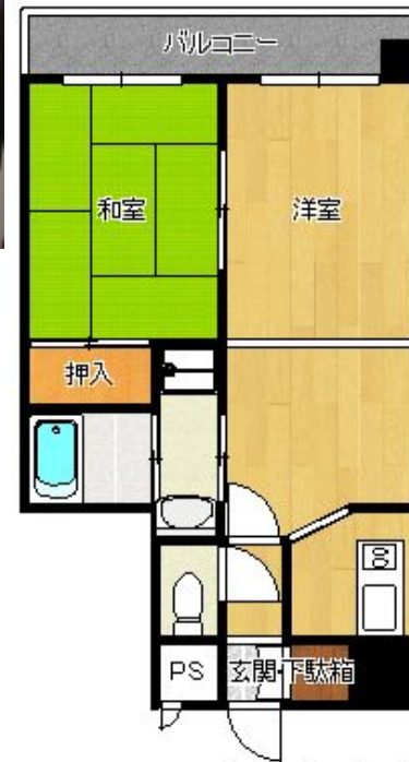
間取り図は現況を優先します